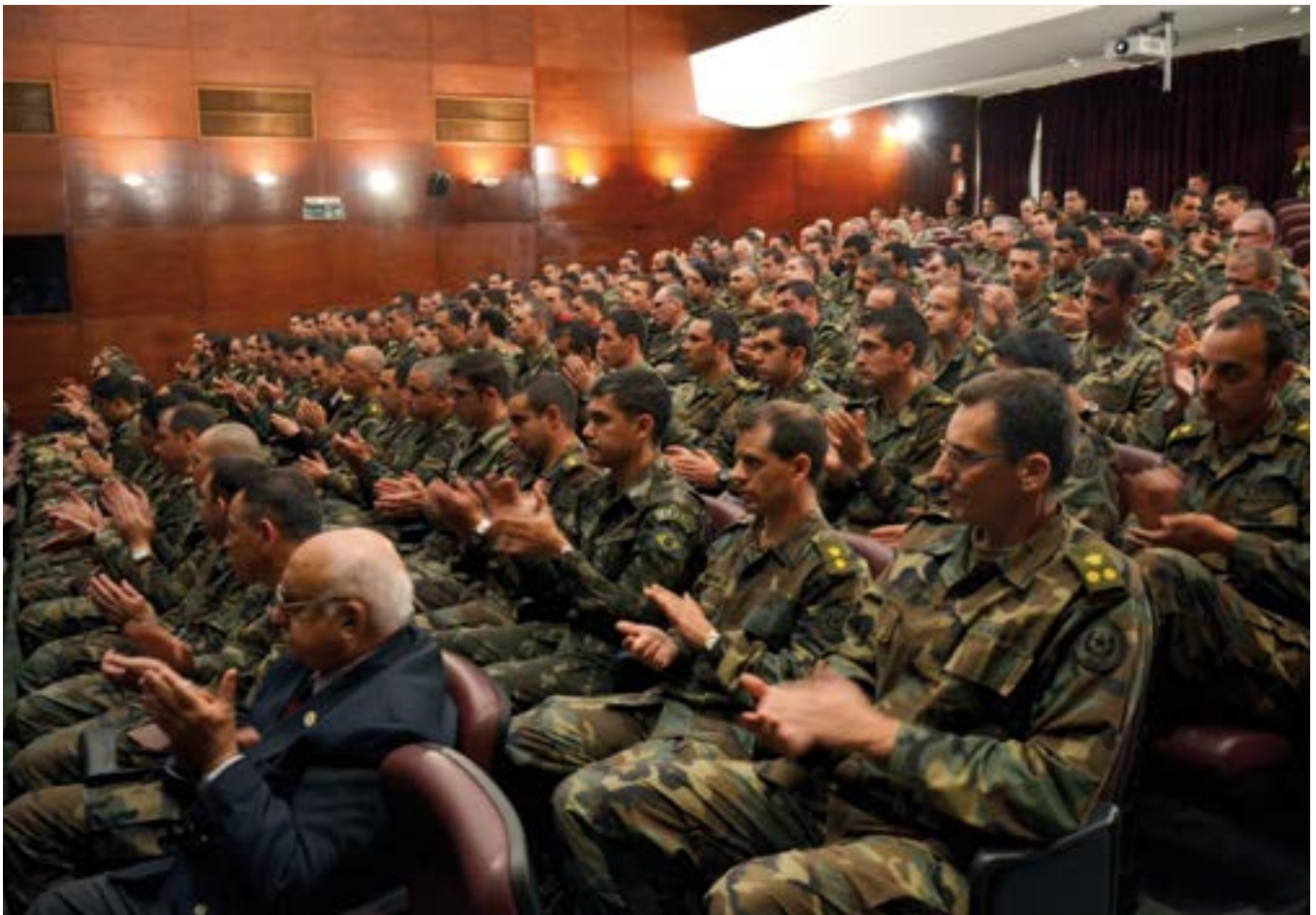
Entre sus funciones, el IMES es anualmente sede de numerosas conferencias y presentaciones de trabajos producidos por profesionales de diversas áreas del conocimiento, como por ejemplo Historia, Sociología, Arqueología y Química.

En el camino de evaluación el Inacal ha destacado varias fortalezas. Algunas de ellas son: liderazgo, desarrollo personal, gestión de procesos y planificación.